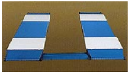
Lắp trên sàn

Có thể chọn lựa cách lắp đặt trên sàn hoặc dưới hố móng