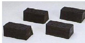
Tấm kê 115 mm (tựy chọn)